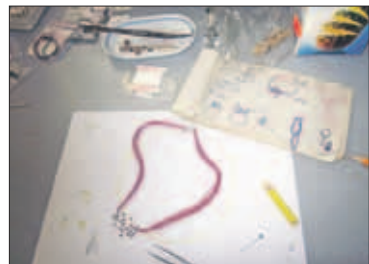
Een halssieraad van zilver, rood email en rood linnen liggend op een serie schetsen in het atelier.