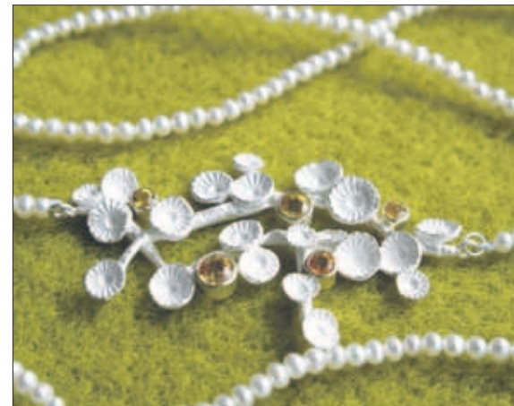
Halssieraad koraalbloesem geel: zilver goud, parels en gele saffieren.