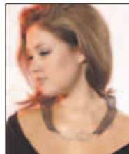
Collier uit de collectie Renaissance Africaine van zilver en ijzer.

Toen Nelissen anderhalf jaar geleden naar Curaçao kwam, greep zij terug op de natuurlijke materialen: „Ik werd gegrepen door het witte koraal en heb eindeloos de patronen en de vormen bestudeerd en was verwonderd over de allerfijnste motiefjes. Ik neem koraal mee naar huis, bestudeer het, maak er afdruken van in klei en fotografeer de stukken. Lang niet allemaal waren ze bruikbaar, ik heb lang moeten sorteren, er waren maar een paar motieven die werkelijk bruikbaar waren in sieraden. Deze sieraden zijn heel fijntjes en gedetailleerd