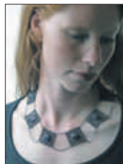
Amethisten: een amulettencollier van zilver en ruwe amethist, uit één van de eerste collecties (2003).